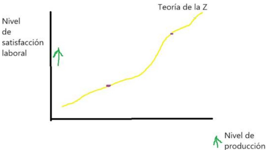
Imagen 3. Representación gráfica directamente proporcional entre la satisfacción laboral y los niveles de producción que se mencionan en la teoría, pues al tener una mayor satisfacción laboral hay más producción.