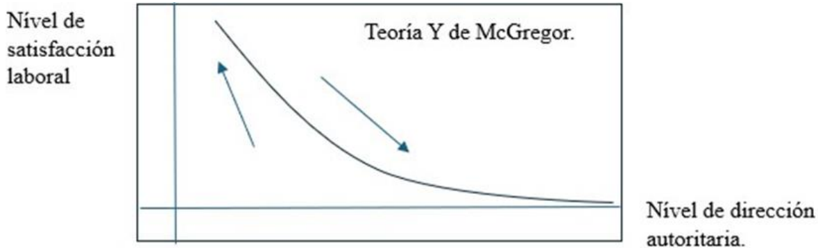
Imagen 2. Representación gráfica de la relación entre los niveles de satisfacción laboral y el carácter autoritario especificado en la teoría direccional Y.